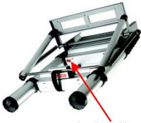
pulsanti per chiusura scala

Le scale a soffietto tradizionali sono economiche e facili da montare ma sacrificano il comfort e la stabilità. Le scale snodabili tradizionali sono molto stabili e confortevoli durante la salita ma più care e complicate da montare. LOFT combina una grande semplicità di montaggio con una stabilità ed un comfort di salita che non hanno eguali.